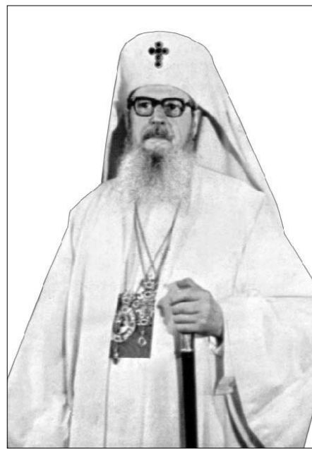
Patriarhul Iustin Moiescu

În anii păstoririi sale, între altele, la 19-20 octombrie 1948 s-a adoptat un nou Statut de organizare și funcționare a Bisericii Ortodoxe Române; s-a refăcut