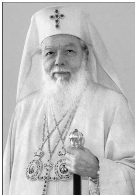
PF Părinte Patriarh Teoctist

care au apărut până acum XV volume, pentru care a fost ales în anul 1999 membru de onoare al Academiei Ro-