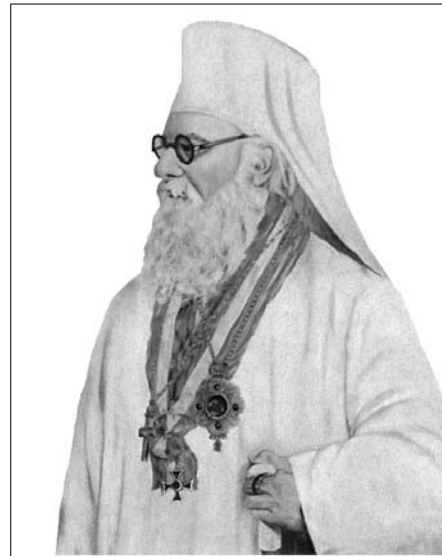
Patriarhul Nicodim Munteanu

a dreptei credințe, strădaniile și sacrificiile făcute pentru ocrotirea Orientului creștin căzut sub turci, care i-au asigurat din partea tuturor dreptul la recunoștință, precum și poziția de întâietate ce i-a fost acordată față de celelalte